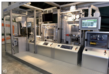
Obr. 2. Ukázky ze sortimentu Yaskawa: a) dvouruký robot Baltazar na výrobu kosmetiky, b) svařovací robot MA1440, c) montážní a balicí pracoviště