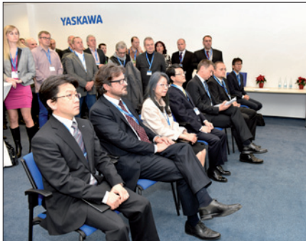
Obr. 1. Sté výročí založení společnosti Yaskawa se slavilo za přítomnosti velvyslance Japonska v České republice Tetsua Yamakawy (v první řadě uprostřed)

Za přítomnosti velvyslance Japonska v České republice Tetsua Yamakawy se ve středu 9. prosince 2015 v Chraštaněch slavilo sté výročí založení japonské společnosti Yaskawa Electric Corporation (obr. 1). Za