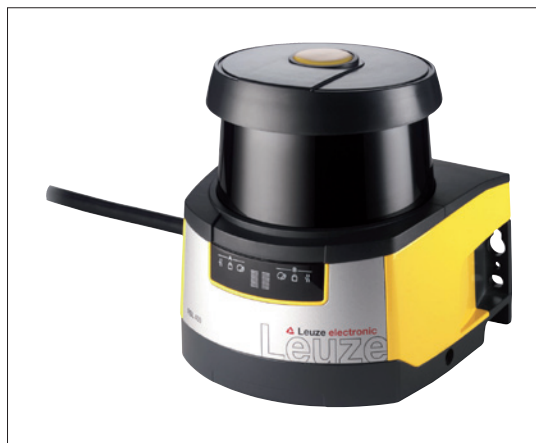
Obr. 1. Nový bezpečnostní laserový skener RSL 400

400, navržené na základě desítek let zkušeností, jsou spojeny vynikající technické parametry s nepřekonatelnými možnostmi vy-