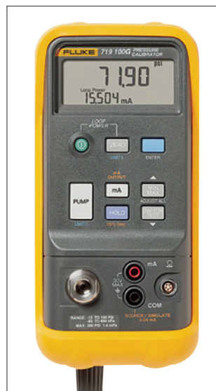
Obr. 1. Kalibrátor tlaku Fluke 719

Zásilková firma Distrelec má ve svém katalogu produkty od více než tisícovky výrobců elektroniky, elektrotechniky, měřicí techniky, automatizace, tlakovzdušných zařízení, nářadí a příslušenství. Bohatě zastoupený obor měřicí techniky obsahuje mnoho snímačů fyzikálních veličin. Mezi nimi najdou zájemci užitečný kalibrátor tlaku Fluke 719. Tento ruční přístroj je určen ke kalibraci senzorů absolutního a relativního tlaku. Vzhledem k robustnímu provedení s ochranným rámem lze přístroj použít i ve venkovním prostředí. V kalibrátoru je zabudována elektrická pumpa, kterou lze ovládat jednou rukou. Také programovatelná rozhraní výrazně zjednodušují měření.