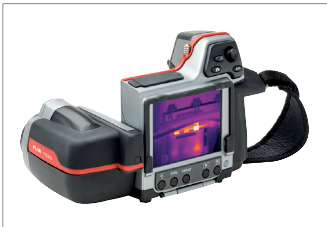
Obr. 1. Termovizní kamera FLIR425 je lehká a snadno se ovládá

V rozsáhlém katalogu zásilkové firmy Distrelec je v oddílu měřicí techniky nabízena termovizní kamera FLIR425 (číslo produktu 919216). Jde o malý lehký přístroj, který se velmi dobře ovládá. Vyměnitelný infračervený objektiv je vestavěn ve sklopném pouzdře. Termovizní obrazy s rozlišením 320 × 240 bodů mají velmi dobrou kvalitu. Kamera má měřicí rozsah -20 až 1 200 °C, rozlišení 0,05 °C nebo 0,08 °C (podle typu) a pracuje při minimální měřicí vzdálenosti 0,4 m.