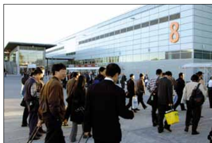
Obr. 1. Výstaviště v Düsseldorfu (vstup Nord)

Několik statistických údajů: přihlášeno je téměř 400 vystavovatelů, kteří obsadí 24 000 m 2 výstavní plochy (údaje jsou z října 2009). Ve srovnání s minulým rokem je to propad o 25 % u vystavovatelů a 35 % u vý-