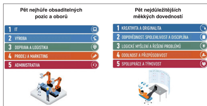
Obr. 2. Průzkum společnosti ManpowerGroup, červen 2022

v procesu vytváření a správy dat o stavbě. Smíšená realita umožňuje kombinovat digitální modely staveb s realitou. Panel Trendy ve stavebnictví studentům ukázal, jaké možnosti tento sektor nabízí.