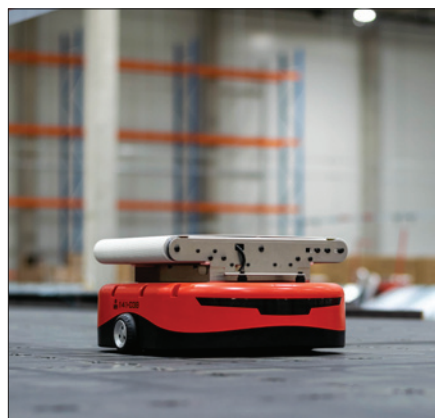
Obr. 1. Vozík AGV Packman na robotickém molu v logistickém depu Zásilkovny

Zásilkovna, patřící do skupiny Packeta, otevřela v Rudné u Prahy nové logistické depo. V areálu Prologis Park Prague má Zásilkovna k dispozici prostory o rozloze 12 600 m 2 . Hala je opatřena třiceti speciálními vraty, kam zajíždějí vozidla pro nakládku a vykládku zásilek.