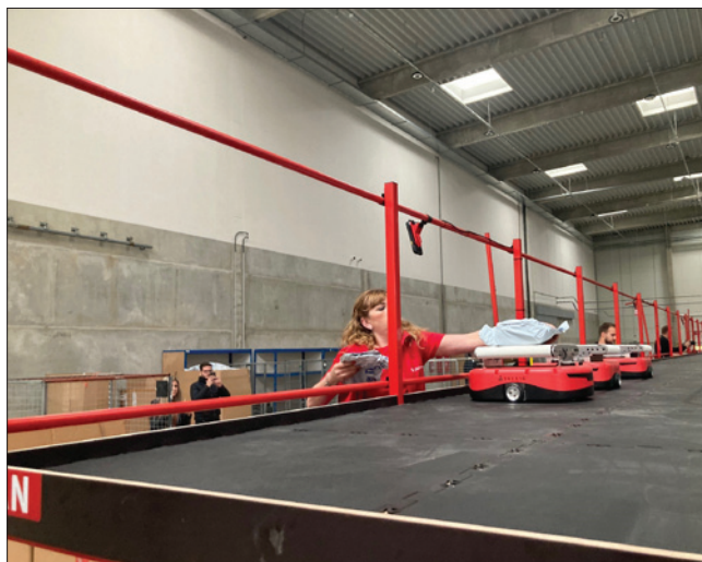
Obr. 2. Zásilka je po načtení čárového kódu naložena na vozík Packman

Vozíky AGV Packman uvezou zásilky o rozměrech až 40 × 40 × 50 cm a hmotnosti až 15 kg. Vozíky dokážou jezdit a třídít zásilky na jedno nabití dvě hodiny a nabíjejí se pouhých 10 min. Oproti systému, kdy zásil-