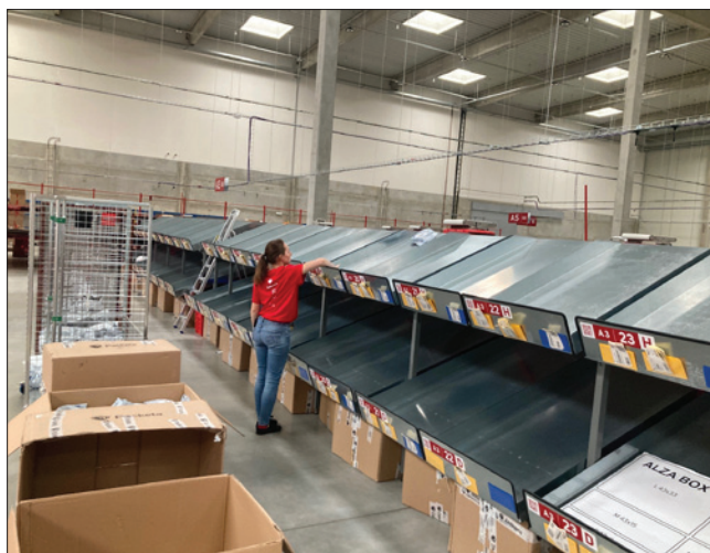
Obr. 3. Vozík vykládá zásilku na skluz příslušného výdejního místa

ky třídí lidé, roboty za hodinu mohou odbavit a roztřídit dvojnásobek zásilek, tedy více než 10 000 zásilek.