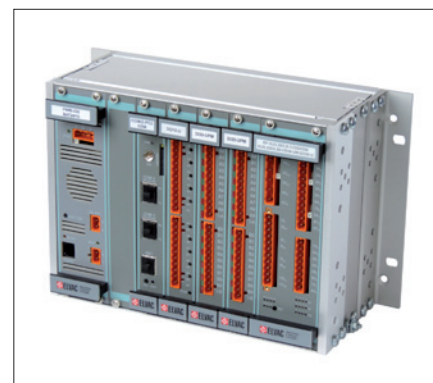
Obr. 2. Řídicí jednotka RTU7M

rováno zabezpečení pomocí TLS ( Transport Layer Security ). TLS je možné zvolit pro webové rozhraní používané pro konfiguraci (přístup pomocí HTTPS) i pro komunikaci protokoly IEC 60870-5-104 a DNP3 (obecně pro libovolný protokol na TCP). Zabezpečení je plně v souladu s normou IEC TS 62351-3. Na přání zákazníka je také možné