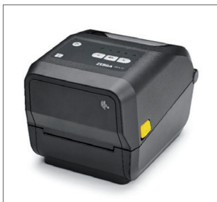
Obr. 1. Termotransferová stolní tiskárna ZD420

Společnost Zebra Technologies dodává robustní počítače, čtečky a tiskárny čárových kódů s pokročilým softwarem, který umož-