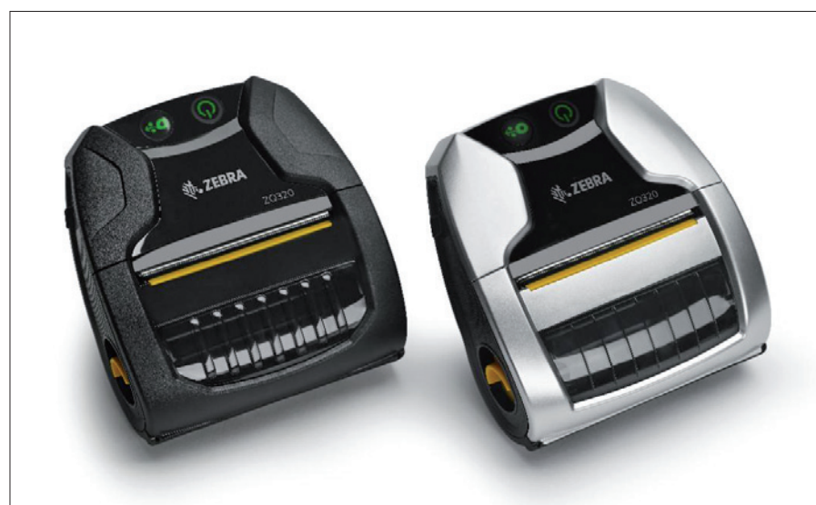
Obr. 3. Termotransferové tiskárny ZQ320 jsou dodávány ve verzi pro použití v interiéru i ve vnějším prostředí

Software Print DNA je tvořen operačním sys-