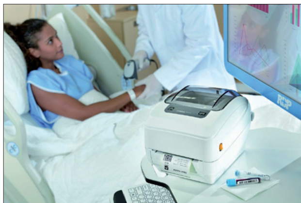
Obr. 2. Stolní tiskárna ZD620 se uplatňuje také ve zdravotnictví

Nové termotransferové stolní tiskárny ZD420 (obr. 1) a ZD620 (obr. 2) a mobil-